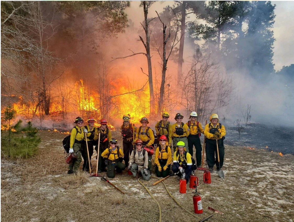
WTREX 2024 Carolina del norte