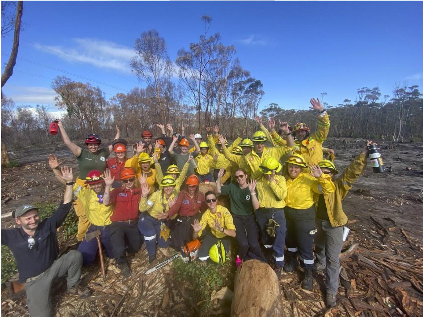
WTREX 2023 Sudáfrica

Éste es un evento que involucra una variedad de agencias que traerá practicantes, investigadores y Técnicos de Manejo del fuego, de diferentes agencias nacionales e internacionales.