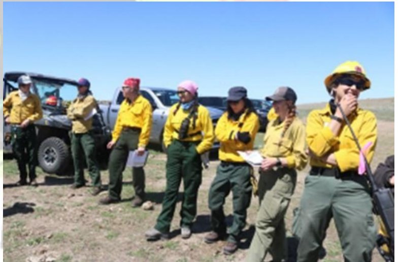
WTREX 2023 Nebraska

Nuestro objetivo es explorar el creciente papel de las mujeres en la gestión de manejo del fuego, al tiempo que proporcionaremos una experiencia de formación práctica para que los profesionales aprendan sobre el fuego como proceso ecológico natural y cómo utilizarlo como herramienta para gestionar los combustibles forestales y el riesgo de incendios forestales en el paisaje.